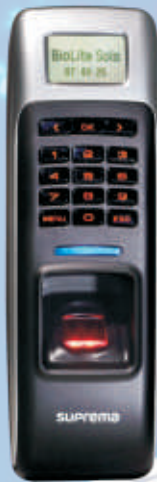
czytnik BioLite Net