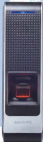
czytnik BioEntry W